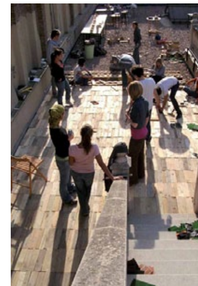
Workshop de EDL en IED Master

La convergencia entre distintas disciplinas sigue siendo un leit motiv para el estudio. La fórmula de la Clínica se vincula a una manera más artesanal de buscar soluciones; sin embargo, ha sido entendida por el ámbito empresarial como un valor añadido. El re-design (diseño y