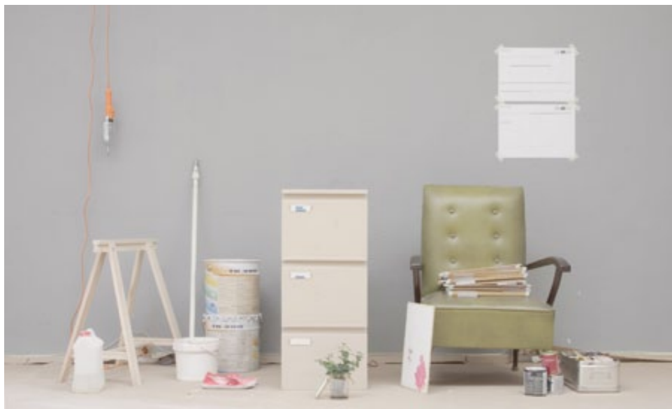
Studio Ciszak Dalmas